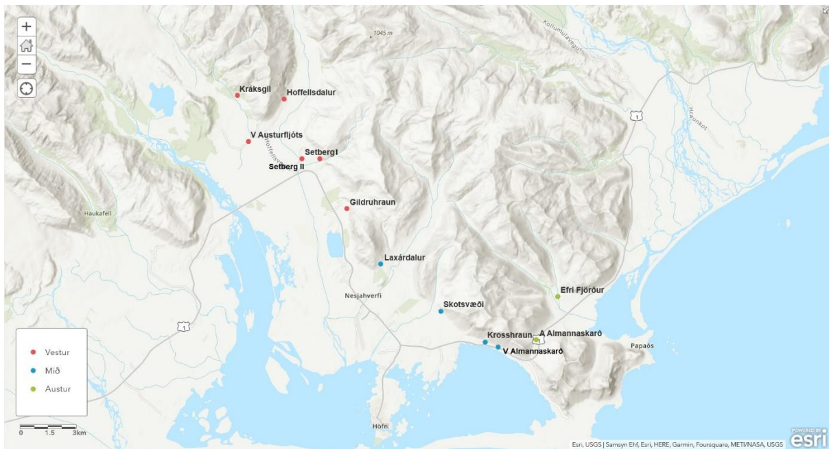
Mynd 2: Staðsetning fallgildra í Sveitarfélaginu Hornafirði sem lagðar voru út á tímabilinu 21. júlí til 16. ágúst. Skipting svæðis sýnt með litum.

Tímabilið 21. júlí- 16. ágúst 2022 voru lagðar út fallgildir á tólf stöðum í sveitarfélaginu Hornafirði, frá Hoffelli og austur fyrir Almanskarað. Rannsóknarsvæðinu var skipt ú í þrjú svæði, austur, mið og vestur. Voru lögð sex snið á vestursvæði ( Setberg I, Setberg II, Hoffellsdalur, Kráksgil, Gildruhraun og vestan Austurfljóts ), fjögur á mið svæði ( Laxárdalur, skotsvæði, Krosshraun og vestur Almanskarað ) og tvö snið voru lögð á austursvæði ( austur Almanskarað og Efri-Fjörður ) (mynd 2). Þar sem áhersla var lögð á skaðlausar gildir voru gildir lagðar út um nótt þegar litlar líkur voru á rigningu til að koma í veg fyrir að vatn safnist í gildrunum og bjöllurnar drukknar í þeim. Gildir voru svo heimsóttar daginn eftir og fjöldi tröllasmiða skráður sem og annarra dýra sem fengust í gildrunar. Allar gildir voru lagðar út í 3 nætur nema gildir á Setbergi II, Gildruhrauni, Kráksgili og vestan Austurfljóts , þær voru lagðar út í einungis eina nótt.