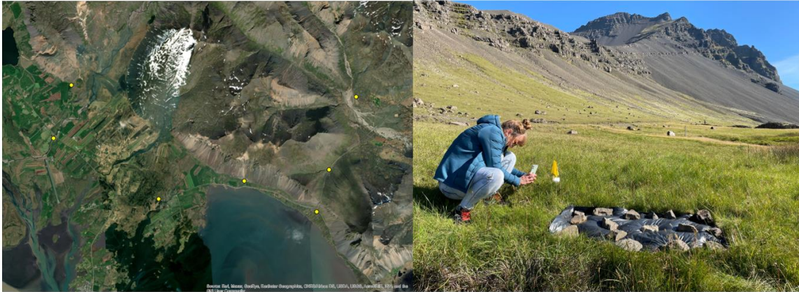
Mynd 1: Til vinstri má sjá kort af gildrum sem lagðar voru út haustið 2021. Hægra megin má sjá gildruna eftir að hún hefur verið lögð úr.

Tímabilið 21. júlí- 16. ágúst 2022 voru lagðar út fallgildir á tólf stöðum í sveitarfélaginu Hornafirði, frá Hoffelli og austur fyrir Almanskarað. Rannsóknarsvæðinu var skipt ú í þrjú svæði, austur, mið og vestur. Voru lögð sex snið á vestursvæði ( Setberg I, Setberg II, Hoffellsdalur, Kráksgil, Gildruhraun og vestan Austurfljóts ), fjögur á mið svæði ( Laxárdalur, skotsvæði, Krosshraun og vestur Almanskarað ) og tvö snið voru lögð á austursvæði ( austur Almanskarað og Efri-Fjörður ) (mynd 2). Þar sem áhersla var lögð á skaðlausar gildir voru gildir lagðar út um nótt þegar litlar líkur voru á rigningu til að koma í veg fyrir að vatn safnist í gildrunum og bjöllurnar drukknar í þeim. Gildir voru svo heimsóttar daginn eftir og fjöldi tröllasmiða skráður sem og annarra dýra sem fengust í gildrunar. Allar gildir voru lagðar út í 3 nætur nema gildir á Setbergi II, Gildruhrauni, Kráksgili og vestan Austurfljóts , þær voru lagðar út í einungis eina nótt.